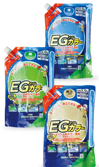
スタンディングパウチ入り