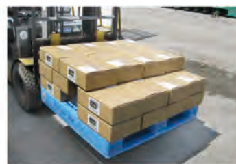
長期保存可能(6ヶ月程度)