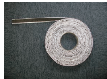
タフショット導水テープ