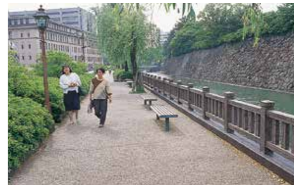
静岡県静岡市青葉シンボルロード