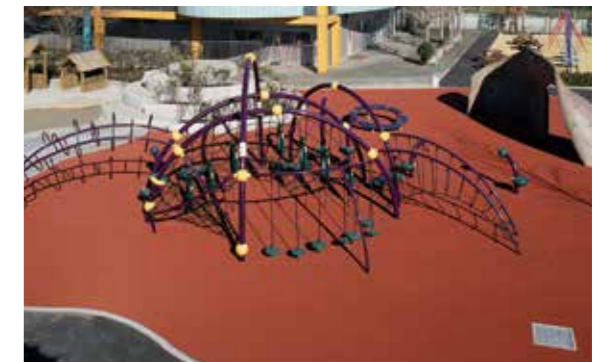
東京都調布市アメリカンスクール・イン・ジャパン