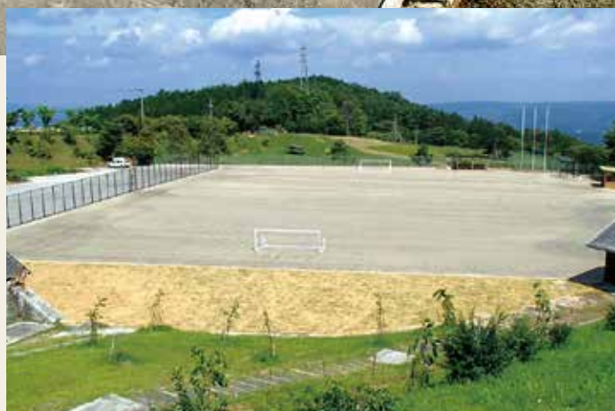
愛知県旭高原元気村