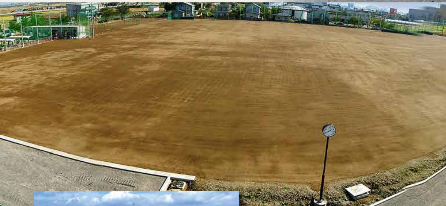
青森県南津軽郡藤崎町立藤崎中学校

オイルサンドは、人工的に製造した疎水性を有する砂で、現地土や良質土と混合することで、降雨後の回復力を格段に向上させます。混合した土は、一般的なクレイ材が主体であるため、自然な感触はそのままです。